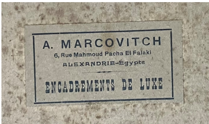
Étiquette de l'encadreur