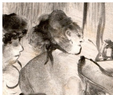
Le Client sérieux (détail) Monotype sur papier vélin -21 x 15,9 cm Ottawa, Musée des Beaux Arts du Canada