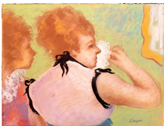
Éloge du maquillage