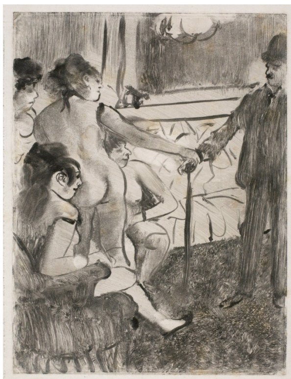
Edgar Degas Le Client sérieux

Éloge du Maquillage est une scène de bordel, thème important dans l'œuvre de Degas qui a puisé nombre de ses représentations de nu dans ces lieux dont il était familier. Il en a tiré des pastels mais aussi des monotypes dont la plupart ont été retrouvés dans son atelier à sa mort en 1917. Or, le musée des Beaux-Arts du Canada (Ottawa) conserve un monotype, Le Client sérieux , où l'on voit une jeune prostituée faire des propositions à un client de la maison close. À l'évidence, Degas a repris deux personnages de ce monotype pour réaliser Éloge du Maquillage .