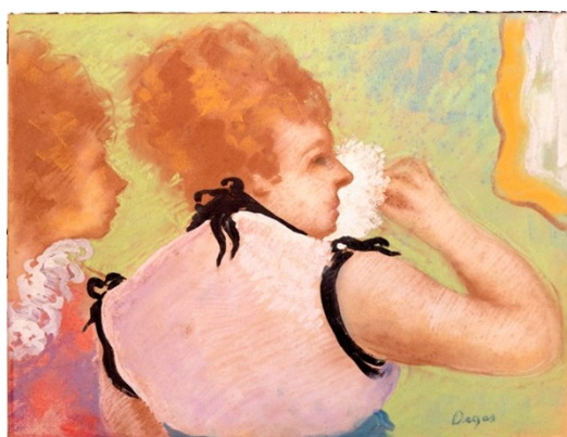
Edgar Degas (1834-1917)